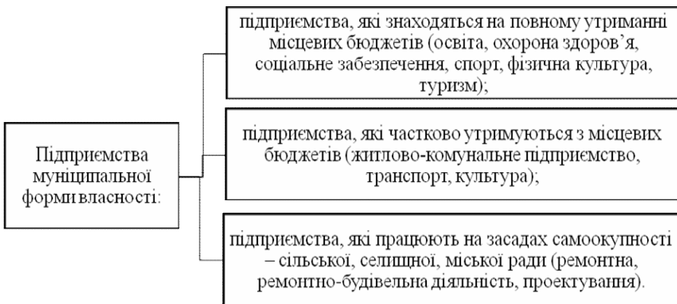
Рис. 1. Види підприємств муніципальної форми власності*

Підприємства муніципального господарства мають понад 20 напрямів діяльності, які охоплюють практично всі основні сфери життєдіяльності людини (житлового господарства, санітарно-технічна сфера, транспортна, комунальної енергетики, комунального обслуговування) (рис. 1).